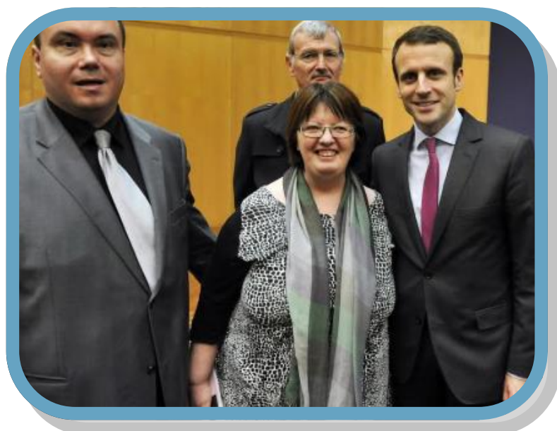
Notre équipe aux côtés de M. Emmanuel Macron.