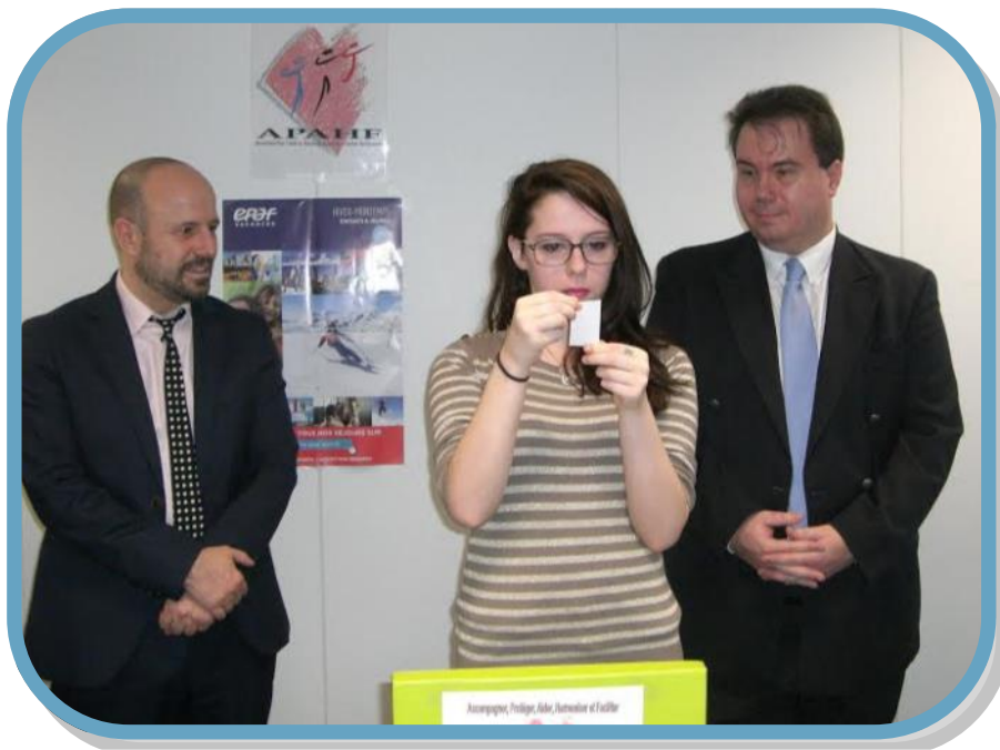
Tirage au sort de la Tombola, le 3 décembre dernier.

Merci pour votre générosité, bravo pour la belle mobilisation des vendeuses et vendeurs de tickets et félicitations aux gagnantes !