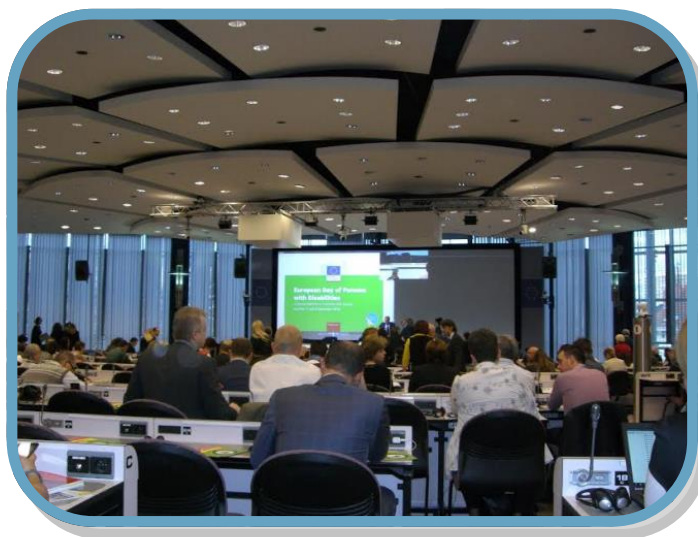
Le Forum se déroulait au siège de la Commission européenne à Bruxelles.

Le thème central de cette année a donné lieu une fois encore à des interventions et des débats très riches : le droit à l'éducation pour les jeunes européens en situation de handicap.