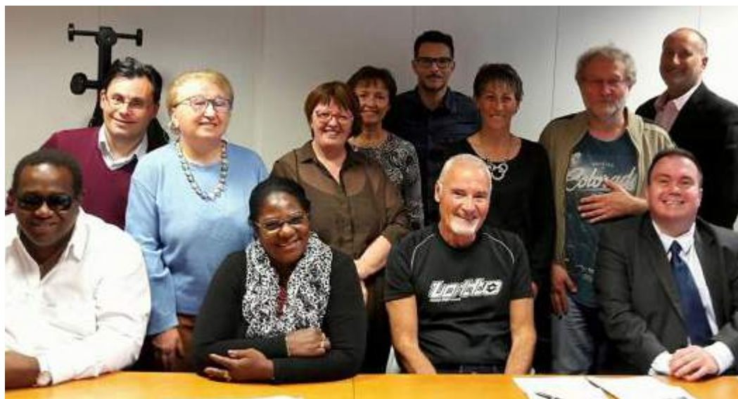
Les membres du Conseil d'Administration de l'APAHF

revue de l'association - n° 4 février - septembre 2017